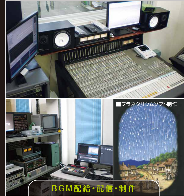
BGM配給・配信・制作